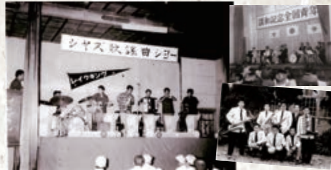
レイクキング「ジャズ歌謡曲ショー」