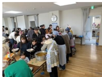
「おかわりください！」