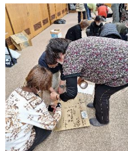
段ボールで簡易トイレ作り