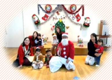
親子サロンミニクリスマス会

また、日々の暮らしでの心配ごと、悩みごとなどがございましたら、お気軽にお近くの民生委員・児童委員までご相談ください。