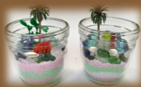
イベントで作成したサンドアート