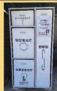
蛍光灯回収箱 ※駐輪場