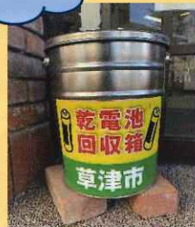
電池回収箱 ※玄関、郵便受下