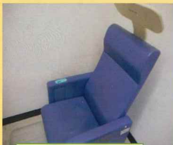
ヘルストロン ※電位治療器