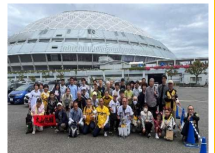
於 バンテリンドーム(名古屋)

5月25日(日)プロ野球観戦ツアーを実施しました。阪神×中日 5×1 で阪神が勝利を収めました。9回表のタイガースの猛攻やプロのプレーと大歓声に、参加者みな大興奮でした！