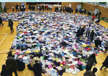
仕分け作業前にTシャツの形に並べての記念撮影

松原中学校2年生が取り組むスクールESD「松原未来学習」において、《リユース》をテーマに学習を進め、(株)ファーストリテイリング(ユニクロ・GU)が展開する“届けよう、服のチカラ”プロジェクトに参加しました。各家庭で着なくなった子ども服を世界の難民キャンプに届けるため、市内各所に回収ボックスを設置し、集まった服の総数は7,234着にもなりました。この取り組みが全国中学校の優秀校(3校)に選ばれ、2月7日に同社有明本部(東京都)で開催されたプレゼン報告会・授賞式に参加、審査の結果、見事最優秀賞に輝きました。2年生の仲間全員の努力が形になりました。地域の多くの方々には、たくさんのご支援・ご協力ありがとうございました。