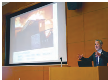
語りべによる講話