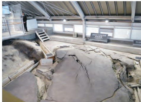
野島断層 (国指定天然記念物)