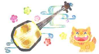
3/4(火):閉講式・三線を愉しむ 美ら夢

サークル活動（費用負担あり）時間は講座終了後60分程度 ☆料理 ☆手芸 ☆歌声サロン ☆グラウンドゴルフ