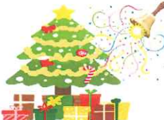
12/11:クリスマス会 堅田ハッピーベルズ