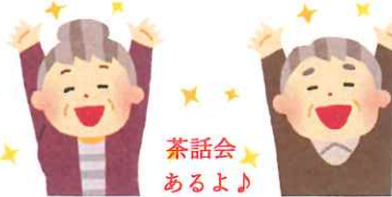
11/6:笑って楽しくレクしましょ♪ 龍谷大学 レク龍サークル