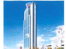
10/2:館外学習 大阪さきしまコスモタワー