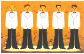
5/22:開講式・まほろばコンサート 男性合唱団まほろば