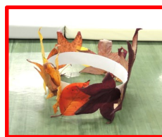
落ち葉の冠の完成!