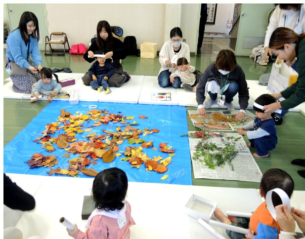
冠づくりに夢中♪ 頭のサイズはこれくらいかな?