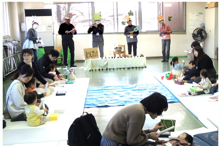
上手に太鼓をたたいてみましょう♪