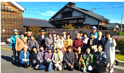
いよいよ散策に出発♪

最後に、近江八幡にちなんだ「野菜膳(丁子麩・赤こんにゃく・近江牛・日牟禮餅など)」をいただき、お土産を買うなどして、古き良き近江八幡を深く知る一日となり、皆さん十分楽しまれたことと思います。