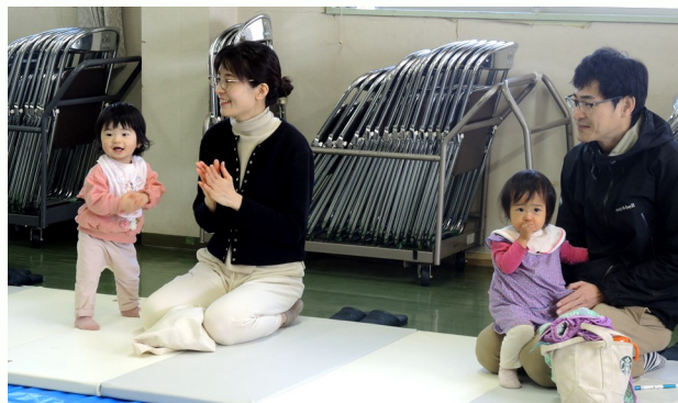
お芝居たのしいね～♪

最後は、用意した落ち葉などを、自分の頭のサイズに合わせた画用紙に貼り付け、かわいい葉っぱの冠も作りました。参加者の中には、素足のお子さんもいて、みんな元気いっぱいでした。