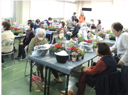
どう植えようかな? エ夫も楽しみ♪