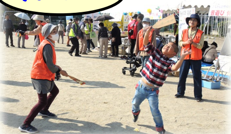
昔の遊び「羽子板で勝負!」