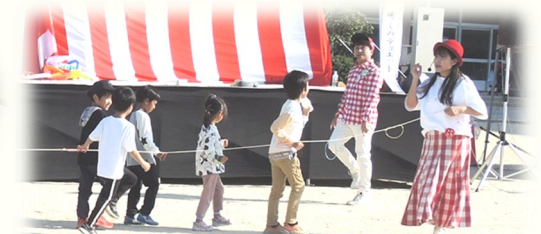
みんな一緒に、GINLALAコンサート♪