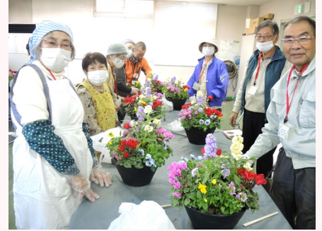
オリジナル花鉢の完成～!