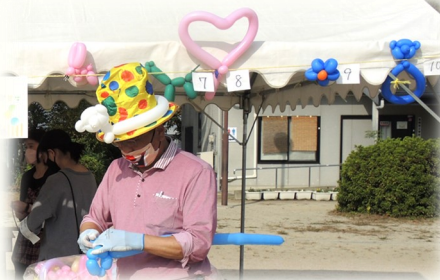
何ができるかな?「バルーンアート」