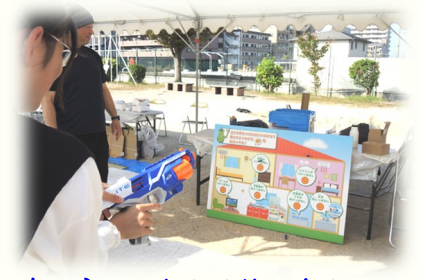
省エネにつながる的に向かって 「エコシューティングゲーム」