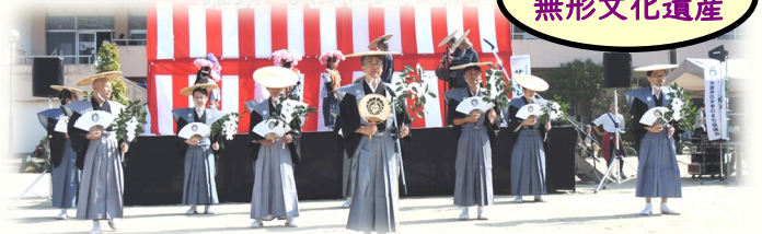
継承者の皆さまによる「矢倉のサンヤレ踊り」