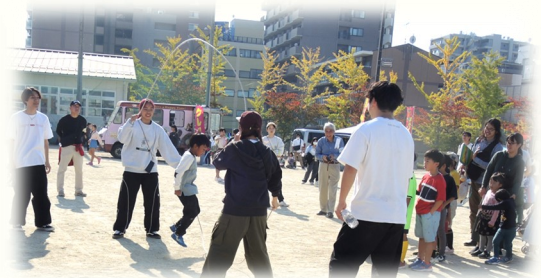
縄跳びの曲芸「ダブルダッチ」に 子どもたちも挑戦!