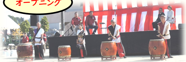
10年以上活動!「風林火山」のふれ太鼓