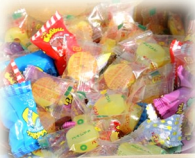
ご寄付の 「パインアメ」 であめつかみ