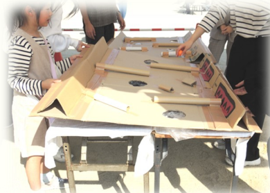
「迷路コロコロバイキング」