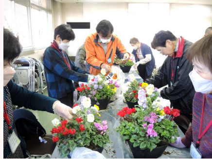
先生の手ほどきに従って。。