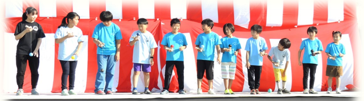
チャンピオンも輩出!「けん玉クラブ」