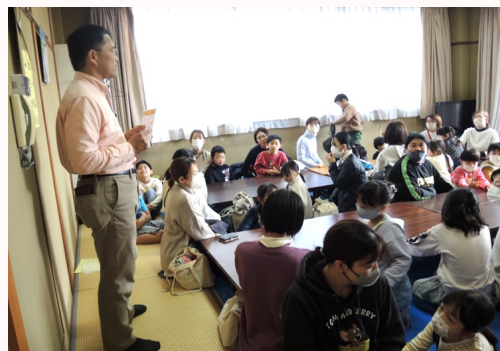
親子で「手前みそ」を作らしよう♪