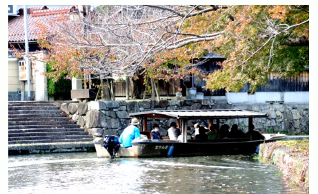
船上から眺める八幡の情景は格別