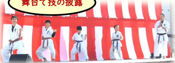
日ごろの鍛錬の成果「空手:月心会」