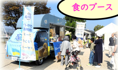
「ウクライナ料理」のキッチンカー