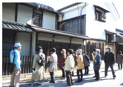
近江商人の街並みを見学