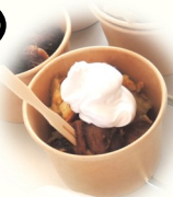
おしゃれな 「ホイップ さつまいも」