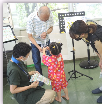
赤い甚平がお似合いです♪