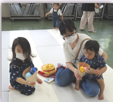
ほら見て～アイスできたよ♥