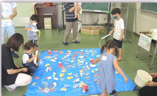
さかなつりは得意なんだ♪

コロナ禍の影響で、時間短縮の開催となりましたが、コロナ予防対策をしっかりと整えて多くのお子さんたちを迎えることができました。ご協力いただきましたスタッフの皆さんに感謝申し上げます。