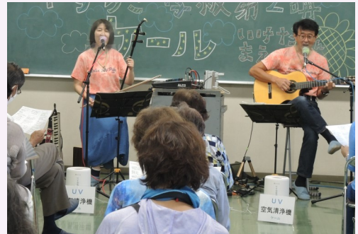
二胡とギターの絶妙な組み合わせ