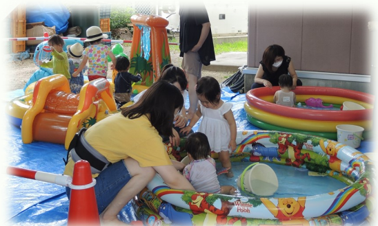
「やっぱり夏は、水遊びが最高で〜す!」

9月22日(水):「よ〜いどん!」(10:30~12:00)ミニ運動会で楽しみましょう! 申込不要・参加費無料 です。持ち物/飲み物・タオル等 お気軽にご参加ください。(社会福祉協議会、民生委員・児童委員協議会)