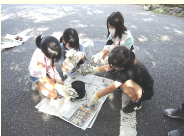
飯ごうで上手く炊けたかな?