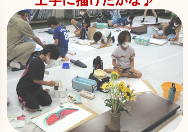
上手に描けたかな♪