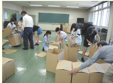
ダンボールでベッド作り