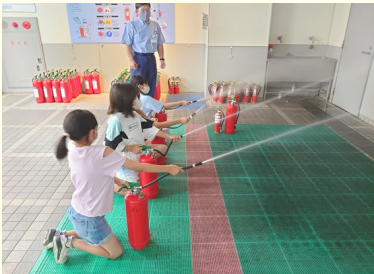
消火器の使い方覚えたよ♪

【後感】2日間の体験学習を無事終わりました。今後も未来を託す子どもたちに必要な防災の知恵や工夫を習得してもらうため、この講座を継続していく必要性や大切さを痛感しました。