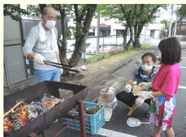
食べることは大事だもんね♪