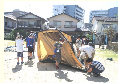
テント設営はまかせて♪