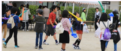
ご来場 ありがとう ございました