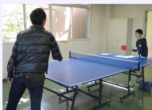
お父さんには負けないよ♪