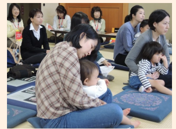
親子で楽しいひととき♪