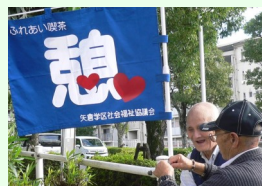
この旗が目印です