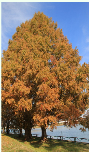
(文 T.M)