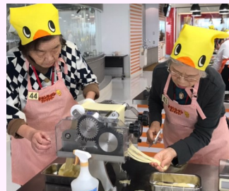
プレゼントされた可愛いヒヨコの三角巾を被り、みんな真剣♪