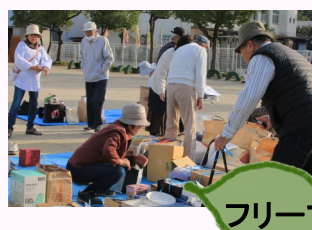
フリーマーケット