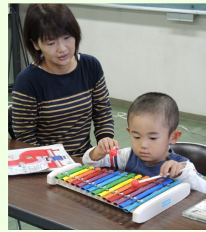
綺麗な音色に興味津々でした♪