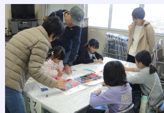
何ができるのかな？