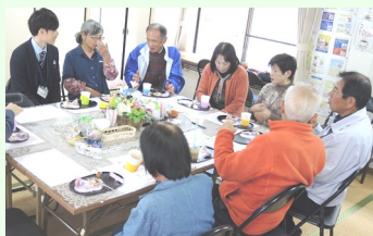
テーブルを囲んで話が弾みます