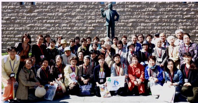
安藤百福銅像を背景にみんなで記念撮影♪