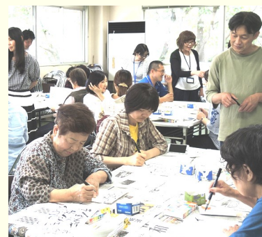
時間が経つのを忘れてしまいそう♪