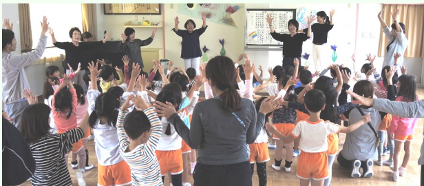
手話の歌を一生懸命習いました♪

最後に、園児と「おたまじゃくしさん」とが笑顔でハイタッチをして次回の交流を愉しみにお別れしました。