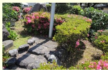
施設の周囲がきれいになり気持ちよくお迎えができます