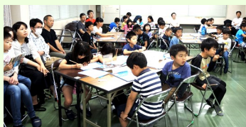
熱心に聞き入る生徒たち