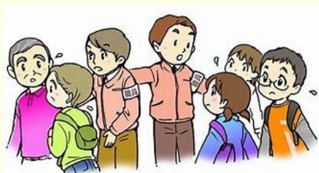
いざという時のために避難訓練も大切ですね

1.6月5日(水)、矢倉まちづくりセンターで26団体、40人の参加を得て避難訓練を実施し、1階事務所から出火という想定で、非常口や館内の避難ルートを職員が誘導し、各部屋から外に無事避難する手順で実施しました。