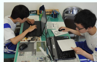
設備清掃やチラシ作りにチャレンジしてくれました