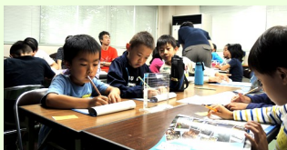
体験談のまとめも真剣!