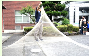
見事な投網さばきを披露