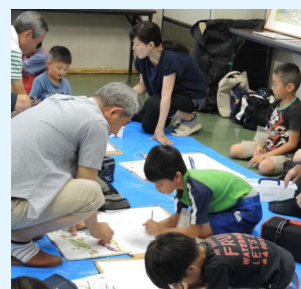
指導よろしきを得て上手く描けたかな♪