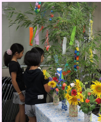
キレイな七夕と生け花♪