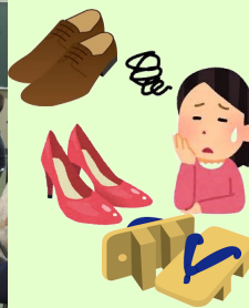
役立ちそうな課題やな♪