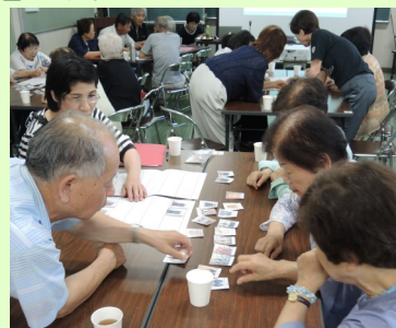
会話に熱が入ります!