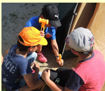
テント設営に興味深々!

夕食のバーベキューも 自分たちで食材を串に刺 しての準備です。その際、 手渡した薄いゴム手袋は 彼らの格好のオモチャに なり、作業の後には目や 口が描かれた「風船」に なってしまいました。