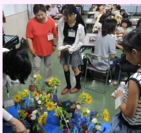
生け花の体験学習♪