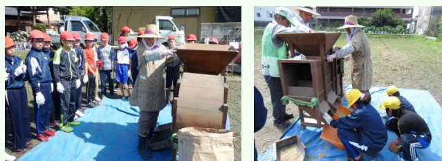
「とうみ」を使った作業に興味津々！