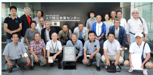
参加された皆さん、全員集合！