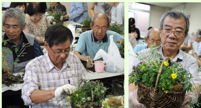
男性も大活躍、皆さんも一緒に♪