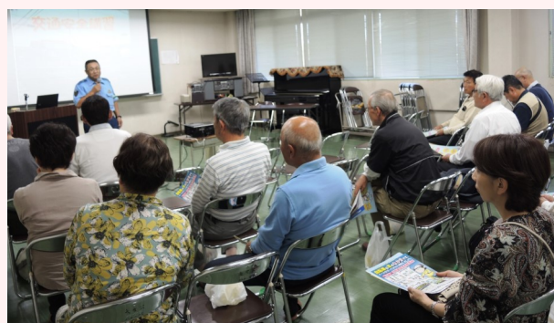
新しいルールを熱心に聞き入る皆さん