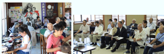
大野木たまり場食堂「よどころ」

9月2日（土）、町会長委員会と社会福祉協議会のメンバー16人が、まちづくりの先進地として、米原市の「大野木長寿村まちづくり会社」へ研修に行きました。大野木地区は、147世帯の小規模集落の農村であること、住民全員が顔見知りであること等々、単純には矢倉学区のまちづくりの参考にするには難しいところではありますが、「地域の課題は地域で解決」「住民が住民のために知恵と力を結集」「高齢者支援訪問事業」など、設立の考え方や「高齢者ビジネス」という持続可能な運営方法など、特記すべき活動が多々あったと思います。また、高齢者の居場所づくり、子ども食堂、見守り活動の方法なども大いに参考になりました。（町会長委員会）