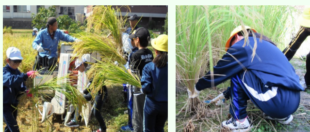
コンパインでの作業、便利になったなあ のこぎり鎌、うまく使えるかな？