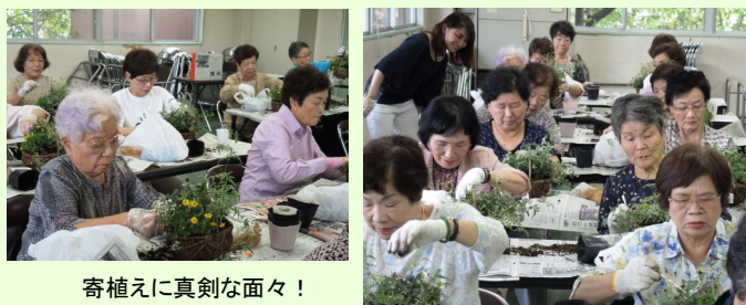
寄せ植えに真剣な面々！

3週間を経て「秋の涼風に揺れ次々に花をさかしている様子を眺めながら、家族で癒されています」「四季折々にこのような講座を開いてほしい」など、嬉しいご感想をいただきました。