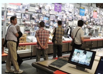
展示コーナーに見入る参加者

語り部のお話や館内の写真や実体験にもとづく映像を見て、改めて震災の恐ろしさを痛感しました。また避難生活での二次的被害のひどさも伺うことができ、私たちの取り組み方ひとつで、減災対策を効果的にできることを学ぶことができました。