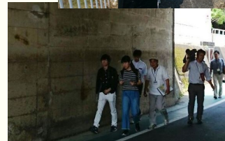
注意深く観察しながら歩く「町あるき」