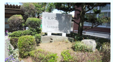
雑草が抜かれて、こんなにきれいになりました♪