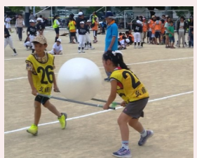
ふたりの息もピッタリ！

矢倉学区の成績は、大玉リレーの3位（玄甫町）が最高でした。ディスコン、ペタンク、大縄跳びと、各種目に参加していただいた皆さまには本当にお疲れさまでした。（体育振興会）