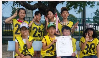
賞状を囲んでにっこり！やったで！