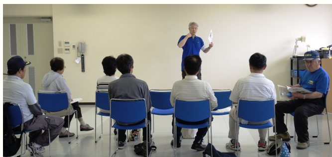
基本的な説明をよく聞いてからね！