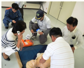
模擬訓練にも熱が入ります！

救命活動を行うためには注意しなければならない点が多々あり、今までの単なる知識と体験とは違い、真に役立つ訓練だと痛感しました。