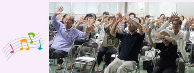
歌に合わせて、みんなで手話を♪