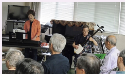
ご指導も熱が入ります！

活動の様子は、矢倉まちづくりセンターの掲示板にも貼りだしていますので、興味のある方は、ぜひご参加ください。期間の途中からの参加も大歓迎です。心からお待ちしています！