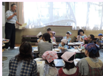
楽しく学んで健康にならしましょう