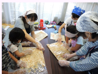
豆を丁寧に潰すのがコツなのよ

6月17日（土）、矢倉まちづくりセンターに於いて、「MOAかんさい健康センター」の食育推進員の指導の下、19組の親子が本教室に参加しました。材料を混ぜ合わせ愛情を込めてコツコツ丁寧に指で大豆をつぶしました。参加者は大豆を指でつぶすのが「むつかしいなあ」と話しながらも最後まで根気よく味噌仕込みができました。熟成期間4か月で美味しい味噌の完成。次回の食育活動は「親子でこんにゃくづくり」を予定しています。できあがった味噌の試食もしたいと思います。ぜひ、ご参加ください。