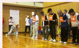
慎重に慎重に、それ！