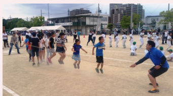
みんなの息を合わせて、大縄跳び