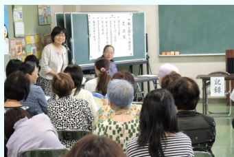
熱心な討論が繰り広げられた

家庭では、温かさや会話と共に、校則違反や未成年の違反（煙草や飲酒）を見過ごさず指導することで、違反や犯罪がエスカレートするのを食い止めることが大切であること。また、地域では、見過ごさない態度や理解ある人とのつながりが非行の未然防止に繋がること。