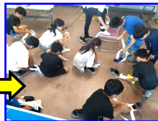
三角巾で足首の固定訓練