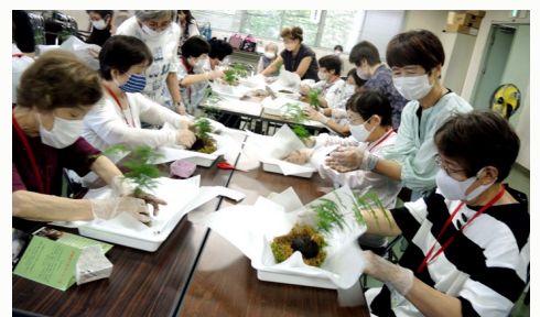
土のまわりに苔を巻き付けます♪