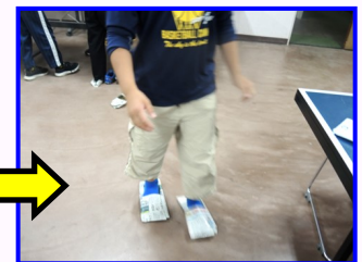
使えることを実感!