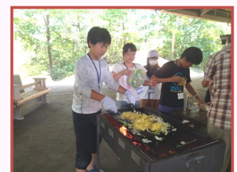
焼きそばづくりもね♪