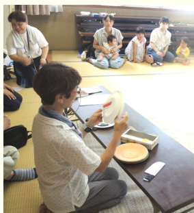
どの動物が出てくるかな?

7月26日(水):暑い日が続く中、23名の親子が参加して、開催しました。 最初に、紙皿を使った「まんまるちゃん(動物当てっこゲーム)」で楽しんだ後、いよいよお待ちかねの「水あそび」へGo~! 水着に着替えた子どもたちは、いろんな種類のプールに入り、暑さを忘れて、お友達と一緒に遊び、はしゃいだりして楽しそうでした。