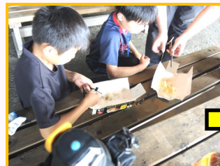
火起こしはコツがいるな