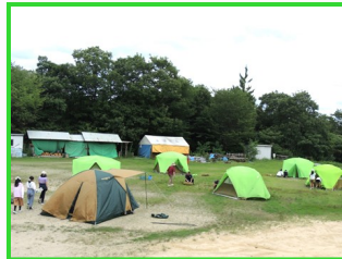
テント設営はみんなで!