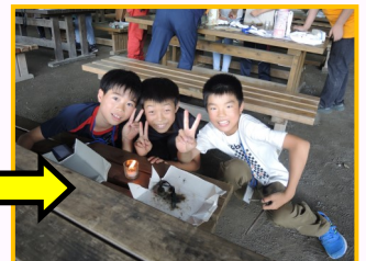
ろうそくに点火成功♪