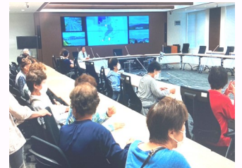
災害対策室で臨場感ある雰囲気を感じた参加者