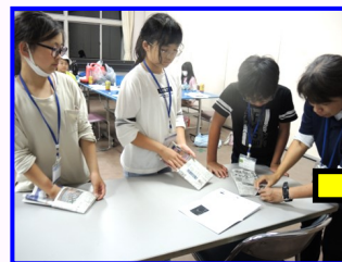
古新聞でスリッパ作り