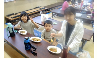
皆で食べるとおいしいね