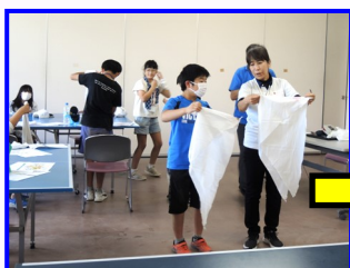
三角巾はこの様に使って