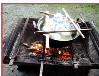
耐熱袋に米・水を入れて炊く