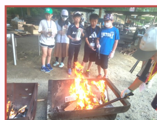
牛乳パックでホットドック!