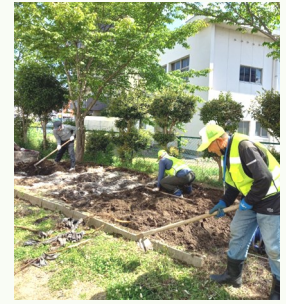
畝作りに勤しむボランティアの皆さん