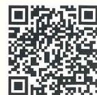
サンヤレ公式PR動画

参考：矢倉まちづくりセンターには、大人と子どもの衣装を展示しています。ぜひご鑑賞を！