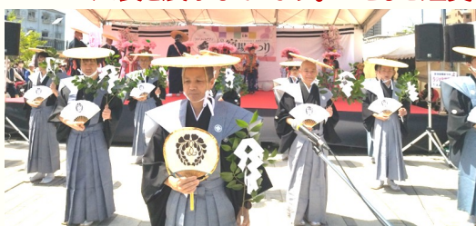
居住組による踊りの披露