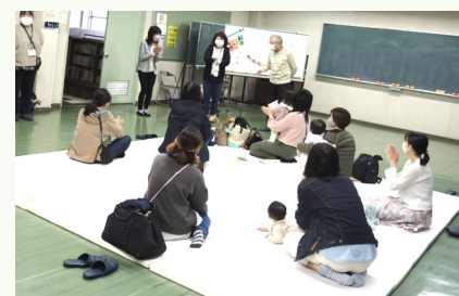
自己紹介、これからよろしくね！

4月26日(水)：今年度最初の子育てサロンに、19人の親子が集まりました。初めての方も多かったので、簡単なスタッフ紹介の後、「どこでしょう」をみんなで歌いながら、順番に子どもさんたちの紹介をしました。絵本の読み聞かせの後、色画用紙や花紙を使って、カラフルなこいのぼりを作りました。 また来月も楽しく遊ぼうね♪