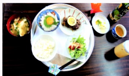
豪華な料理が完成！