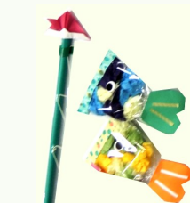
ユニークなこいのぼり♪