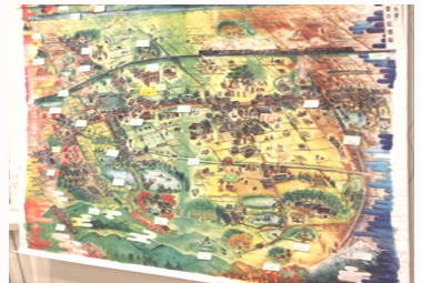
展示会場の壁面いっぱいに展示された絵屏風の様子