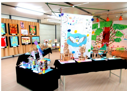
子どもたちの素敵な作品の数々

このような素敵な展示会が開催できるのも、愛情深く受け止めてくださる保護者の皆さんや、地域の方々の熱意のおかげであり、その影響により子どもたちの豊かな感性がより一層育まれていくんだということを教職員一同改めて感じた次第です。(矢倉幼稚園)