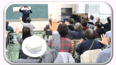
明日は我が身、油断なく！