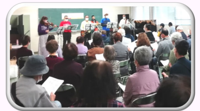
歌声喫茶みたいです♪