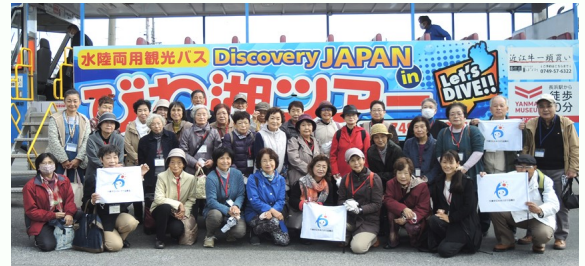
バスの前で記念撮影！皆さんにっこり♪

午後からは、長浜の「黒壁スクエア」などを散策したり「八幡堀」界隈でお土産を買ったりして、楽しい一日を過ごすことが出来たのではないのでしょうか。