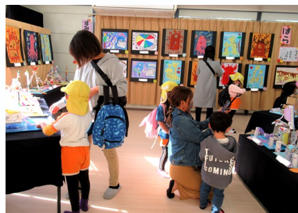
保護者の皆さんも興味津々

お知らせ: 矢倉幼稚園は、今年(令和4年)4月からきれいな園舎になり、幼稚園をベースとして保育所の機能も備えた、幼稚園型の「矢倉認定こども園(仮称)」【3年保育】に移行します!