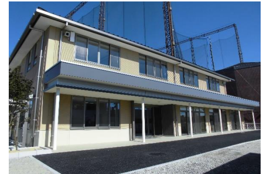
常盤まちづくりセンター