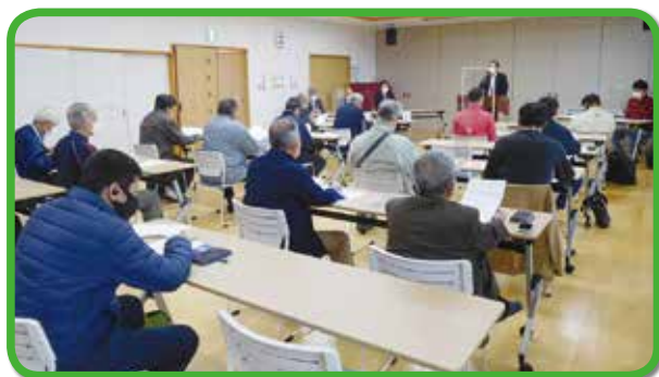
4月17日(土)開催の体育振興会総会