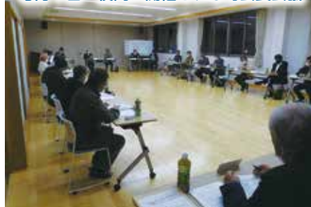
各町内戸数は4月末の数値です