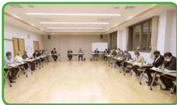
席の間隔を拡げ開催の、学区自治連合会総会

また4月11日(土)には、学区体育振興会、学区社会福祉協議会、学区青少年育成会議の各総会も常盤まちづくりセンターにて開催され、令和2年度の新しい組織が決まりました。