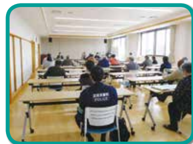
4月11日(土)に開催された学区青少年育成会議総会。