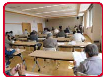
4月11日(土)に開催された学区社会福祉協議会総会。