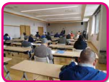
4月11日(土)に開催された学区体育振興会総会。