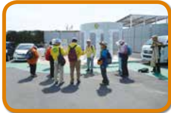
風車跡のモニュメント地から出発

5月3日(祝)「草津ハイキング」が実施されました。サンヤレ踊りと常盤の社寺をめぐるイベントに40数名の方が集い、道中でのボランティアの方たちより説明を受けながら約7kmのハイキングを楽しみました。まちづくりセンターでの説明会では各地のサンヤレ踊りの違い等の話も興味深く聞き入っていました。