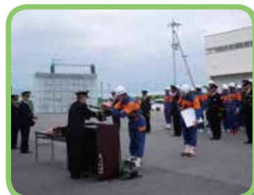
橋川市長より表彰を受ける第6分団