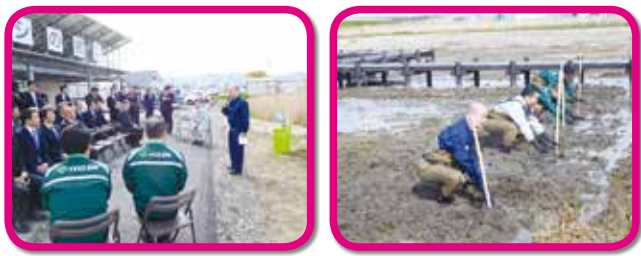
ハス植えをする知事、市長