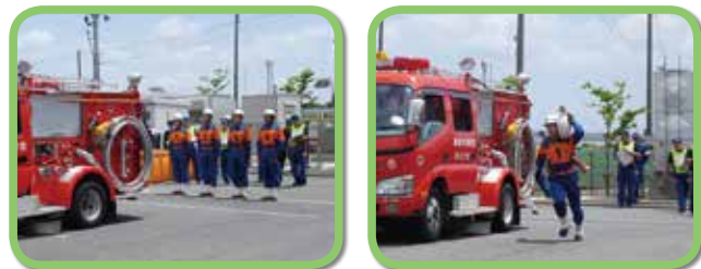
第6分団の消防操法開始