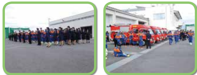
KFFL分団(女性団員)も加わり開会 全分団の消防車集結。出場準備

※第6分団では「消防団で一緒に活動したい」と思う方より、応募をお待ちしています。