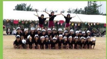
10月11日(日) 草津大谷保育園