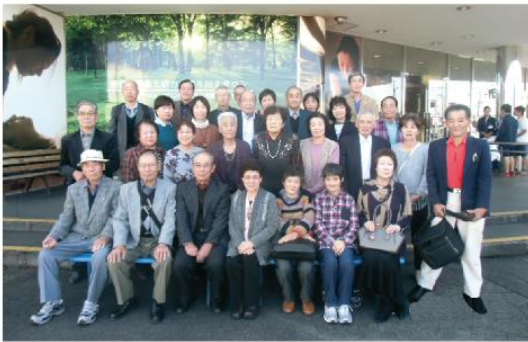
11月11日(水) 身体障害者更生会が四日市方面へ研修に行きました。