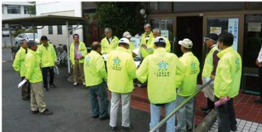
10月10日(土) 町会長が4班にわかれ、常盤学区内の不法投棄の看板 パトロールをおこないました。