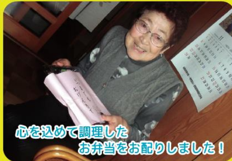
心を込めて調理したお弁当をお配りしました!

11/17(火)には「ひとり暮らしの高齢者」のお弁当を心を込めて調理し、喜んでいただきました。