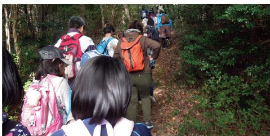
10月31日(土) わんぱくTOKIWA希望ヶ丘でハイキング