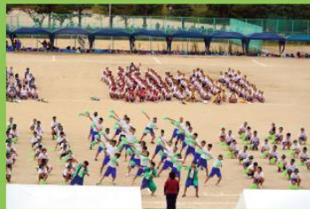
9月30日(水) 新堂中学校