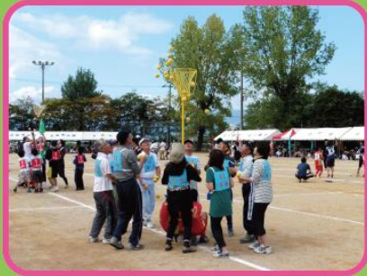
9月27日(日) 常盤学区民運動会