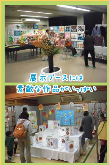
展示ブースには 素敵な作品がいっぱい