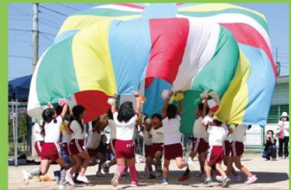
10月3日(土) 第四保育所