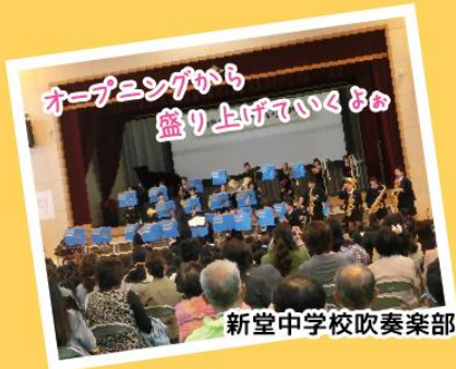
オープニングから 盛り上げていくよ