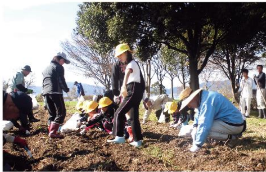
11月16日(月) 常盤小学校4年生が、湖岸緑地で老人クラブのみなさんとスイセンの球根植えをしました。