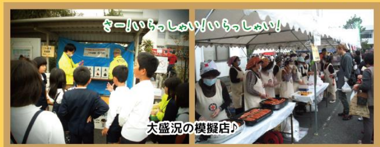
ぎー!いらっしやい!いらっしやい!