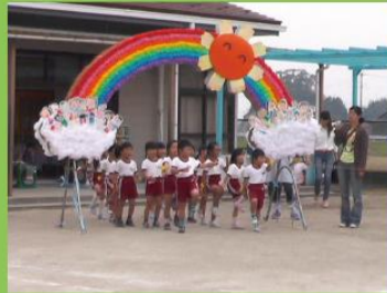
10月10日(土) 常盤幼稚園