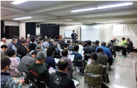
11月17日(火) 防犯教室 振り込み詐欺には気をつけよう!