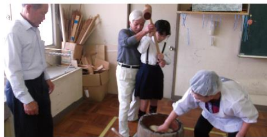
10月22日(木) 常盤小学校5年生が常盤学区老人クラブの皆さんと もちつき！