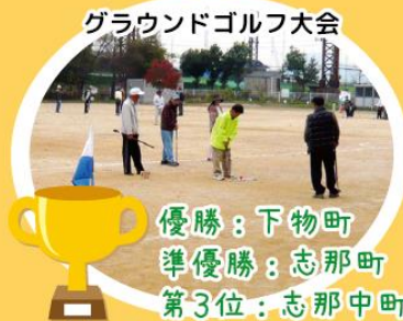
グラウンドゴルフ大会