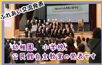
ふれあい交流発表