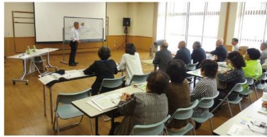
9月30日(水) 同和教育推進協議会と民生委員児童委員協議会が 米原市の三吉会館へ研修に行きました。