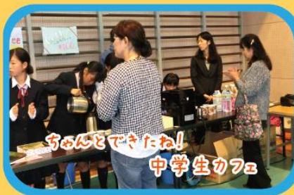
ちろんできたね! 中学生カフェ