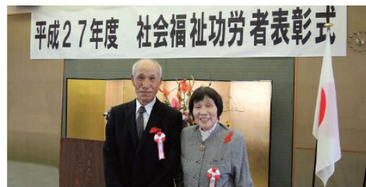
11月7日(土) 草津市社会福祉功労者表彰式典