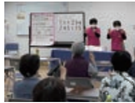
フレイル予防講座