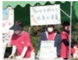
志津ふれあい広場の啓発ブース

～令和2年に発刊された「ふるさと志津の原風景」より毎回1枚の写真を取り上げて現在までの変化を振り返ります～