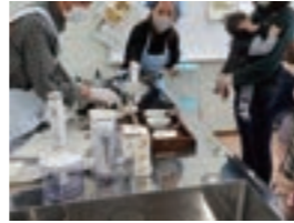
離乳食レストラン