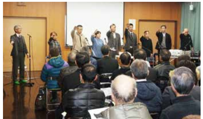
▲たんぼさんによる講演