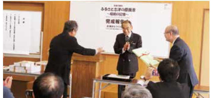
▲市長に写真集贈呈