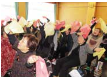
(事務局 政川 純子) ▲一般教養講座の様子

2月21日(金)に、志津まちづくりセンターにおいて、第7回やすらぎ学級を開講しました。今回は、ロクハ荘のスタッフを迎え、「うたと音楽」の力で、楽しみながら身体機能や脳機能の維持・向上を行う音楽健康セッションを開催しました。「♪パタカラで歌おう!」では、カラオケの歌詞を「パ・タ・カ・ラ」に置き換えて歌ったり、「♪おほエルダー」では、カラオケの空欄の歌詞を思い出しながら歌いました。学級生は、真剣に歌詞を覚えたり、抒情歌を歌ったりしながら楽しいひとときを過ごされました。