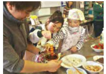
▲団子づくりの様子

2月8日(土)志津まちづくりセンターで「SMTオリジナル団子を作ろう!」を開催しました。志津わんぱく協働校の得意料理であるツイストパン(毎年ふれあいまつりに出店しています)に続く、新