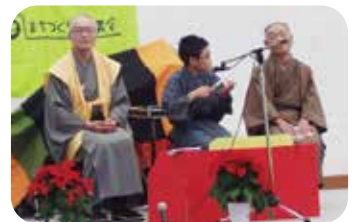
▲リレー落語「初天神」