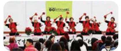
◀ 色鮮やかな銭太鼓