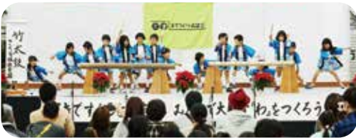
▲さくら坂保育園「竹太鼓」