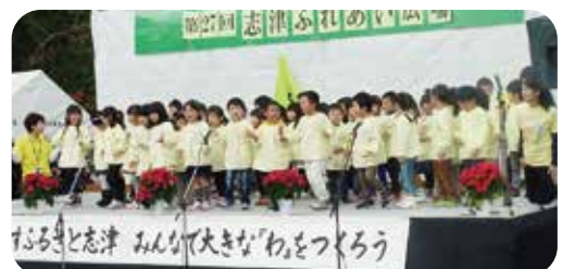
▲志津幼稚園「体操と歌」