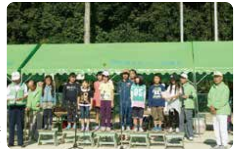
▲まち協の歌を全員で