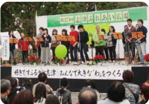
▲志津ふれあいバンド (志津小学校職員)