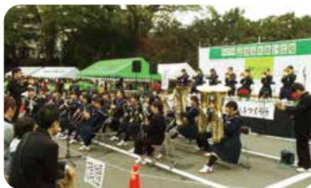
▲高穂中学校吹奏楽部