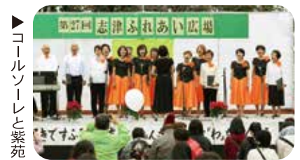
▶ コールソーレと紫苑