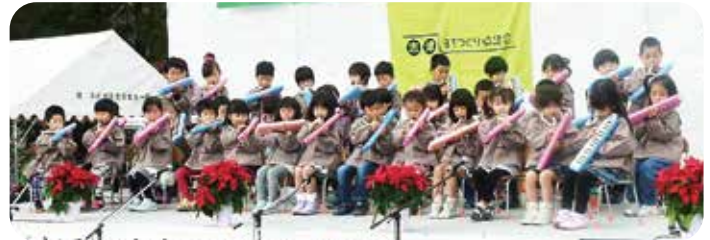
▲志津保育園「鍵盤ハーモニカ」