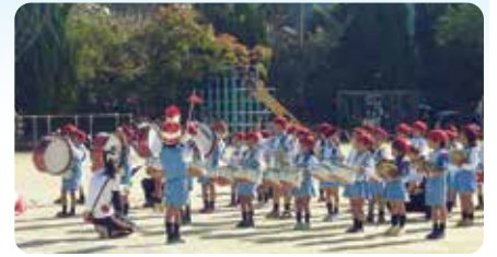
▲志津保育園・鼓隊