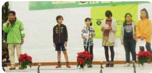
▲「小学生が思い描く志津」発表