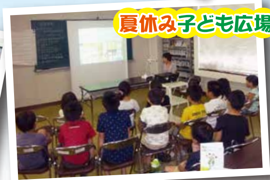
夏休み子ども広場