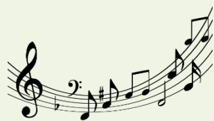
ヴァイオリンコンサート