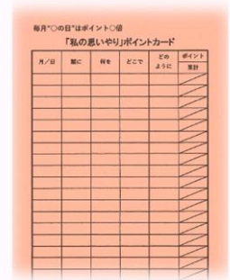
思いやりポイントカード