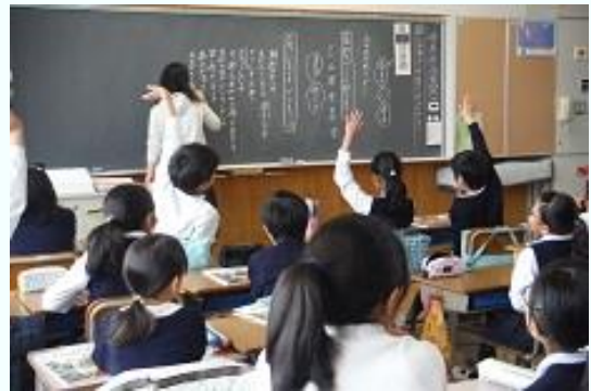
(道徳科の授業風景)

創立のときから、みなさまに支えられ、“地域とともにある学校”として歩んできた渋川小学校も 16 年目を迎えました。教育目標を昨年度に引き続き『人にやさしく 自分を高め みんなのために役立とう』と掲げて、子ども、教職員一緒になってがんばってまいります。また、文部科学省および滋賀県教育委員会の指定による「 道徳教育の推進 」に関する研究も二年次となり、10 月 12 日(金)には県内外の先生たちに取り組みの成果を発表します。これからも、温かなご理解、ご支援をお願いいたします。