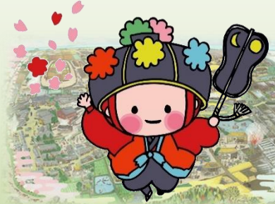
『渋川・風景の記憶絵』と渋川学区のシンボルマーク、マスコットキャラクター“しぶはなちゃん”

編集発行 渋川学区まちづくり協議会 (事務局：草津市立渋川まちづくりセンター内) ☎525-0025 草津市西渋川二丁目 9 番 38 号 ☎077-569-0350 FAX 077-566-5143 メールアドレス shibukawa@machikyouto.jp ウェブサイト http://www.machikyouto.jp/shibukawa/