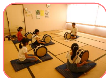
花踊りの太鼓の練習

参加する子どもたちがいて、マスターするのも早く、一生懸命練習しました。伊砂砂神社の灯明祭では一緒に踊り、10 月 29 日(日)の渋川学区ふれあいまつりでは太鼓をたたきます。本番でも上手に踊れたり、太鼓が叩けたりがんばった練習の成果が出ることを願っています。これから先も多くの子どもたちが練習に参加して、「草津市指定無形民俗文化財」としての「渋川の花踊り」が未来永劫に継承していくことを期待します。