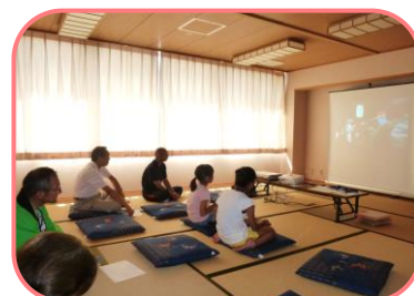
花踊りのビデオをみて勉強

「渋川の花踊り」は、高齢化の影響で担い手が減りつつあります。「子どもたちに受け継いでほしい」と地元の願いで、小学生を対象に渋川花踊り保存会の皆さんの指導による練習会が開かれました。渋川まちづくりセンターで 7 月 15 日から 8 月 26 日までの全 5 回を参加者 5 名で行いました。昨年から続けて練習に