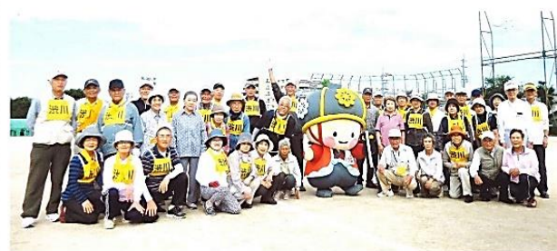
昨年 10 月健康フェスティバル優勝での集合写真