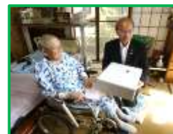
橋川草津市長が祝福