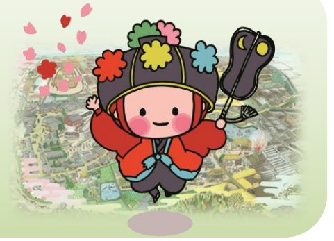
『渋川・風景の記憶絵』と渋川学区のシンボルマーク、マスコットキャラクター“しぶはなちゃん”

編集発行 渋川学区まちづくり協議会（事務局 草津市渋川市民センター） ☎525-0025 草津市西渋川二丁目 9 番 38 号 ☎077-569-0350 FAX 077-566-5143 メールアドレス sc-shibukawa@city.kusatsu.lg.jp ウェブサイト http://kusatsu.or.jp/machikyuu/shibukawa/