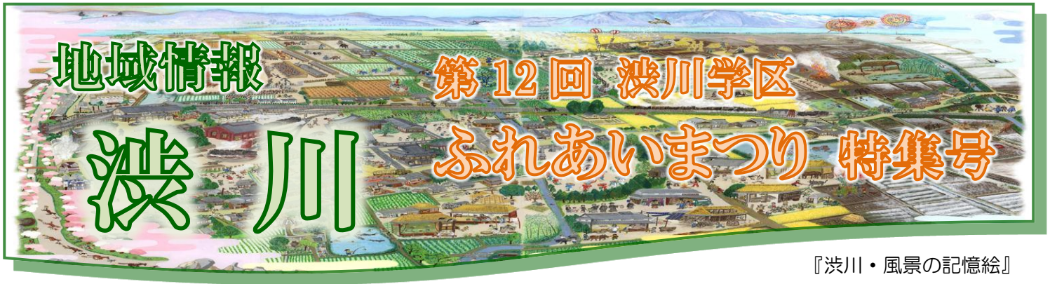
『渋川・風景の記憶絵』