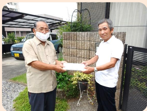
お祝いの品を贈ります!ありがとうございます!