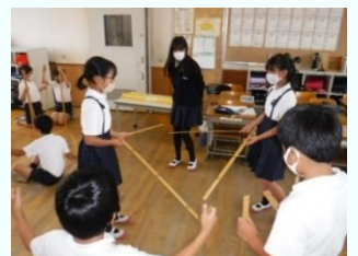
【5年生 算数 マスクをして… 密を避けて…】

新型コロナウイルス感染症の脅威が依然収まりそうにないなかで、短い夏休みを終え、今、学校は再び危機意識を高く保って12月25日までの長い休業期間を歩んでいこうとしています。そして、この間に、学校の大切な教育活動であり、子どもたちも楽しみにしている運動会や修学旅行、校外学習等をなんとか実現したいとあれやこれやの手を尽くしていますが、現時点でなにかを約束できるような状況ではありません。しかし、こんな状況だからこそ、私たちは「渋川 もっとチャレンジ 2020 ～高める! つながる! 認め合う!～」を掲げて子どもたちの健やかな成長を促していきたいと思えます。ご家庭、地域のみなさまにおかれましても、引き続き温かなご理解とご支援をよろしくお願ひいたします。