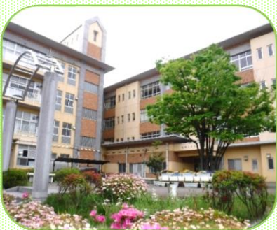
【子どもたちを待つ渋川小学校】

新型コロナウイルスの禍により学校はずっと休業が続いています。学校だけではありません。社会全体が…、世界中が…、混乱し、停滞し、怯えています。しかし今、私たちが過ごすのはとても貴重な時間であると思っています。それは、これまで当たり前感じていた自由やよろこび、たのしみと引き換えにした大切な時間です。この事態にあって、私たちは“学校”の大きな意味を改めて認識しています。“学校”は、教科の学習を学ぶだけでなく、一人ひとりまったく異なる子ども同士が、あるいはもったくさんの人たちとも、つながり、交わり、遣り取り合いながら『自立と共生の基礎を培っていく子どもにとっての大切な社会』なのです。辛いでしょうが、子どもたちがこの貴重な時間を生かし、学校再開の時には、きっと“高める！ つながる！ 認め合う！”そして、“もっとチャレンジ！”してくれることを心から願っています。