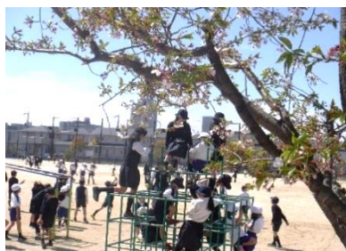
《桜の花が残る運動場で・・・》

っぱい生み出す学校をめざしていきます。これからも、温かなご理解、ご支援をお願いいたします。