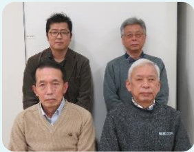
まち協三役の皆さん