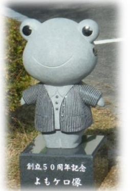
創立50周年記念 よもケロ像

わたしは、草津第二小学校のマスコットキャラクター『よもケロ』と申します。よろしくね★ 50周年を記念して石像にもなったんだよ。