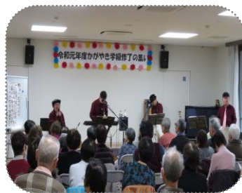
令和元年度修了の集いの様子