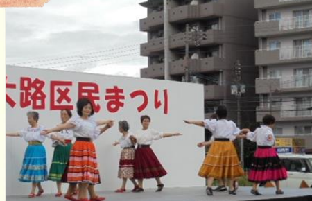
フォークダンス はな

写真は、大路区民まつりで発表をされている様子です。それぞれのサークルで楽しく活動されています。 みなさんもぜひ！！