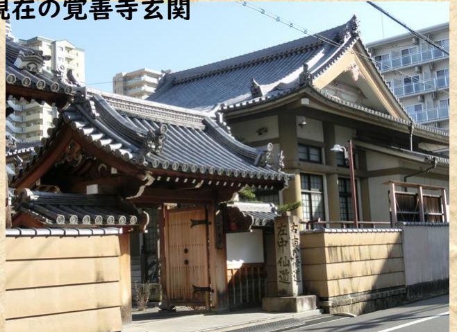
現在の覚善寺玄関