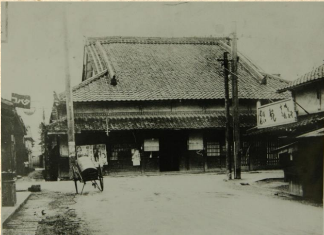
姥が餅屋(うばがもちや)

『姥が餅屋』が、明治25年に草津駅が開設された時、店舗を矢倉から駅前に移して開業されました。間口も広く店内には大きな銅の釜が据えられていました。