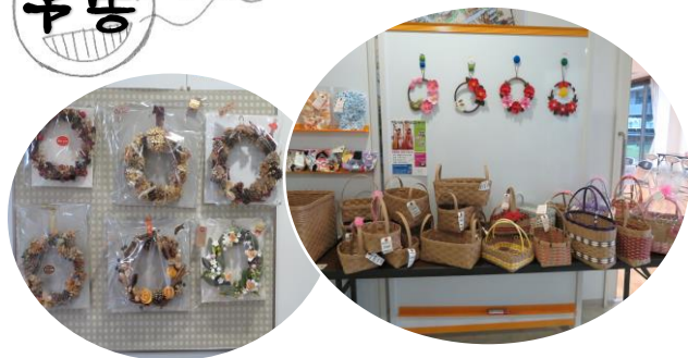
昨年出品された作品