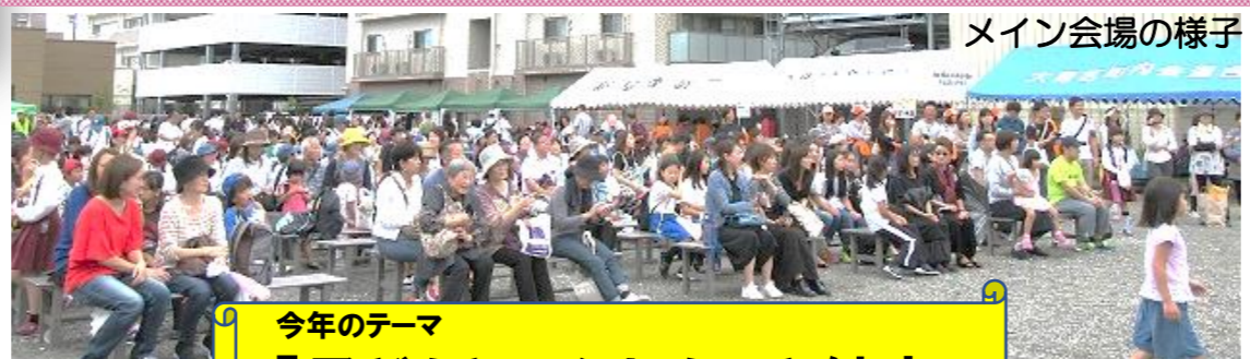
メイン会場の様子