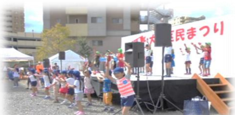
たちばな大略こども園の児童