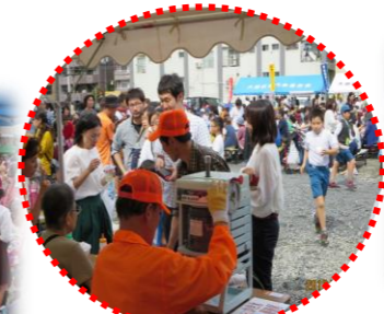
ごみ分別もバッチリ