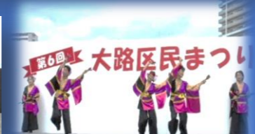
第6回 大略区民まつり