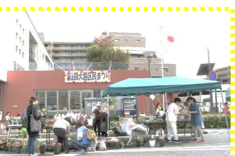
ガーデニング講座