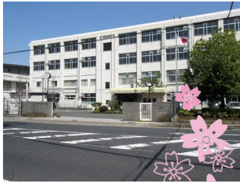
草津中学校 新入生267名