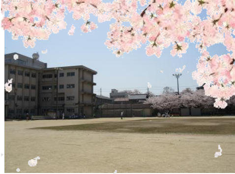
草津第二小学校 新入生115名