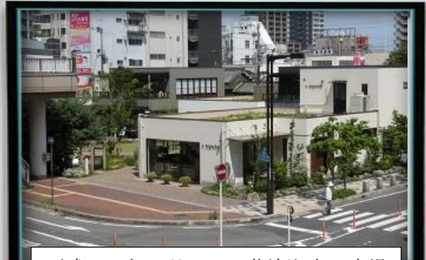
平成26年7月10日草津駅東口広場に「ニワタス」が開店されました。