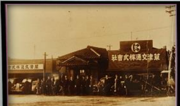
昭和17年頃、駅前のタクシー屋、馬車屋、バス会社が合併されて草津交通株式会社となりました。