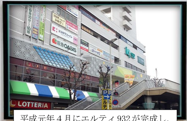
平成元年4月にエルティ932が完成し、「ヒカリヤ」が出店されました。