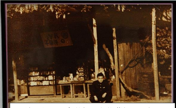
駅前にあった南洋軒の名物藤棚で、店にはお土産も食堂もあり憩いの場所でした。