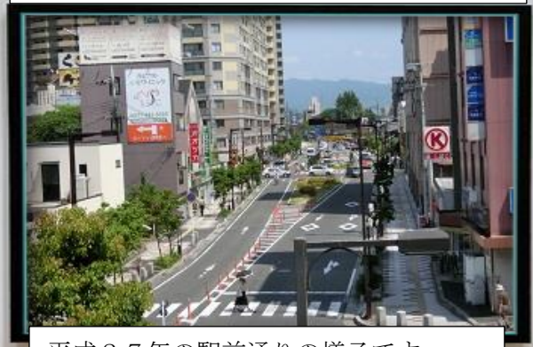
平成27年の駅前通りの様子です。