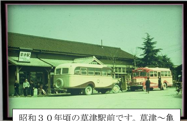
昭和30年頃の草津駅前です。草津～亀山間を走っていた省営バスです。