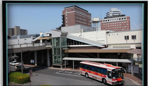
平成24年12月にはエレベーターも設置され、高齢者も一段と便利になりました。