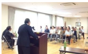
5月9日(土) 評議員会の様子

また、市行政が実施する諸事業等にも連携を深め、支援していきますので関係団体各位の更なるご厚情ご支援ご協力を切にお願い申し上げます。