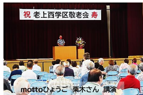
祝 老上西学区敬老会 寿