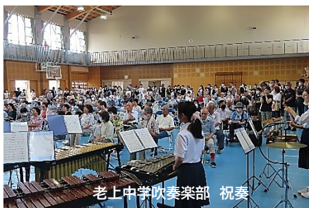
老上中学吹奏楽部 祝奏