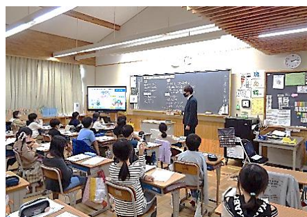
「より良い発育・発達のために、 大切なことはなにか？」を 教室で学ぶ子どもたち