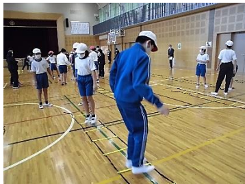
トレーニング用ラダー(はしご)をつかった授業の様子 みんな、真剣なすがたです。 いよいよ、11月に本番です。

本校では、令和2年度から体育科の研究に取り組んできており、主体的・対話的で深い学びを実施するために、子どもたちの関心や向上心を育てることに重点を置いています。ラダリンピックでは目指せ私たちの金メダルを学習のめあてにして、3年間の集大成となるような授業公開ができるように、職員一同力を合わせていきたいと考えています。