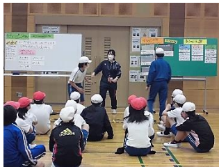
ラダリンピック グループで協力して、 オリジナルラダーをつくり 高得点を獲得する工夫を 見つけよう。