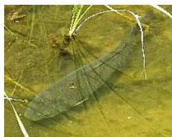
十禅寺川に泳ぐ鯉 2021年4月撮影