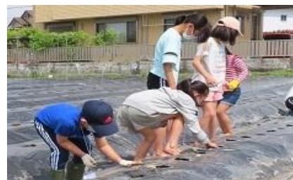
里芋の植付けの様子