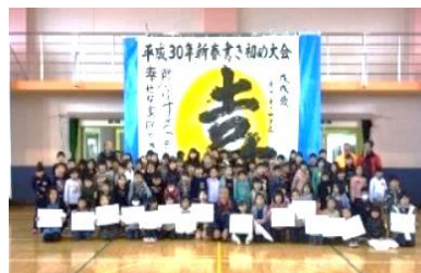
参加者と「喜」の揮毫

また、地域の団体に協力を得て、昔の遊びやニュースポーツを体験。フランクフルト、ぜんざいもおいしくいただき交流を図りました。