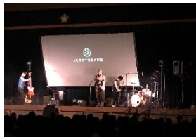
講演ライブの様子

当日は、校長先生のお計らいで各種団体にもご案内させて頂き、多くの地域の皆様にもご参加いただけました。