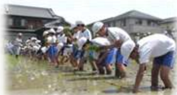
5/24 5年生初めての田植え