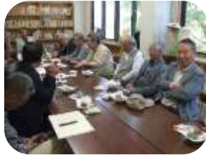
意見を交わした交流会

老上社協と老上西社協は、5月12日老上公民館で、老ク連8名の方と交流会を持ちました。今年度の敬老会の持ち方や老人クラブの会員の減少に歯止めがかからない状況、役員のなり手が無い実情などを話し合いましたが、解決に向けた妙案は見出せませんでした。相互に忌憚のない意見が出されたのが唯一の成果でした。