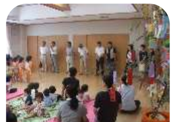
さくら坂東保育所にて