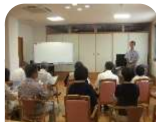
すまいる1号館にて

老上西学区内には、介護事業所や保育所など12の施設があります。学区社協評議員23名は7月7日に、七夕訪問と称してそれぞれの施設を訪れ、入居者・園児らと交流を図りました。