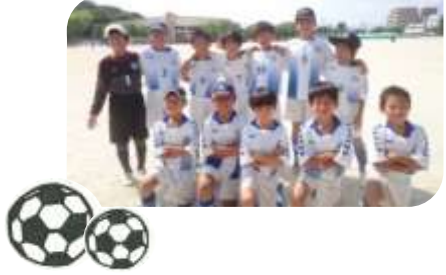
野村グラウンドで開催された玉川サマーカーカップに参加