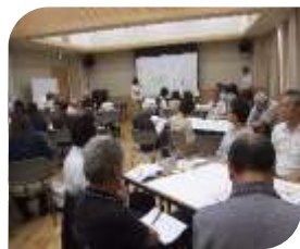
49名がグループ討議

老上・老上西両学区の社協役員、介護支援事業所、長寿いきがい課、包括支援センターなどで組織する標記会議を、6月27日、老上西公民館で開催しました。出席者49名が、「町内で交流もない人」、「交流はあるが地域活動のない人」の見守り活動をいかにするかについてグループ討議しました。