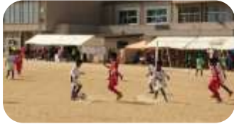
石川県野々市市で開催された樺カップで活躍

試合は随時、土・日曜日で公式戦や練習試合、フットサルなど行っています。毎水・金曜日の夕方と土曜日のお昼からは、両小学校グラウンドでの練習を行っていますので、サッカー好きの少年少女、ぜひ参加してください。