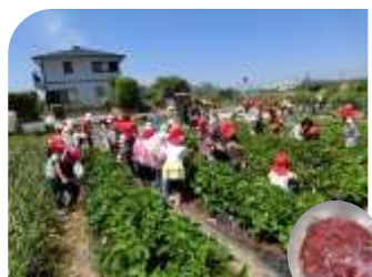
5/18 いちご狩りと美味しそうな手作りジャム