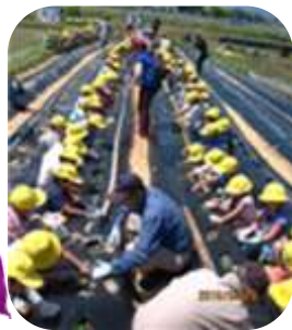
5/18 さつまいもの苗植え