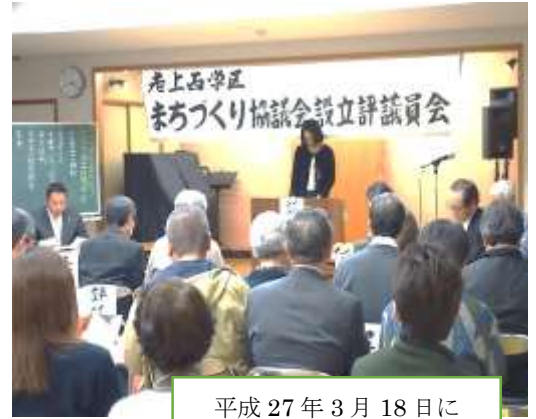
平成27年3月18日に開かれた設立評議員会