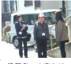
徘徊者への声かけ

2月19日(金) 湖州平町内で、45名が4カ所6班に分かれ、徘徊者(施設事業者)を発見(一般参加者)し、自宅(集会所)まで送り届ける模擬訓練をしました。