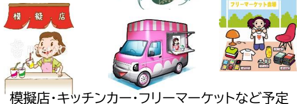
模擬店・キッチンカー・フリーマーケットなど予定

11月5日(日)10:00~ 場所:老上西小学校体育館・ふれあい広場 老上西まちづくりセンター